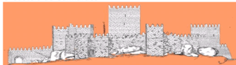
O Castelo de Guimarães

O Castelo de Guimarães localiza-se no Campo de São Mamede, em Guimarães, está ligado à fundação do Condado Portucalense e às lutas da independência de Portugal, sendo também designado como berço da nacionalidade .